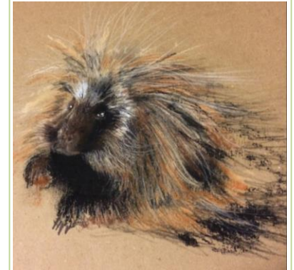
Exemples d'œuvres de Geena Lemire.